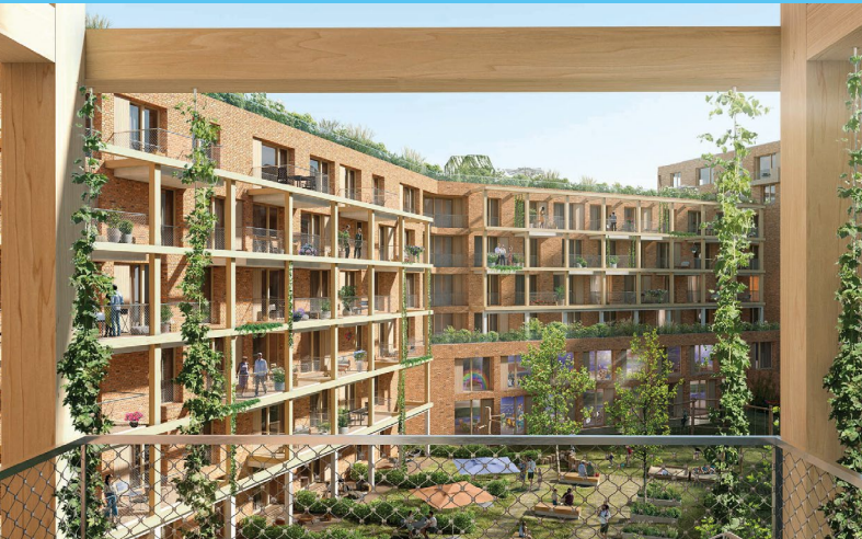
Der neue Stöckach, Stuttgart / asp Architekten, Stuttgart mit LXS, Berlin Prof. Margit Sichrovsky spricht im Seminar Bauen für Kreisläufe, 16.00 Uhr

Die Fakten sind hinlänglich bekannt: Natürliche Ressourcen sind endlich – und werden bereits heute enorm übernutzt. Die damit verbundenen Folgen wie Klimawandel, Bodendegradierung oder Biodiversitätsverlust sind gravierend.