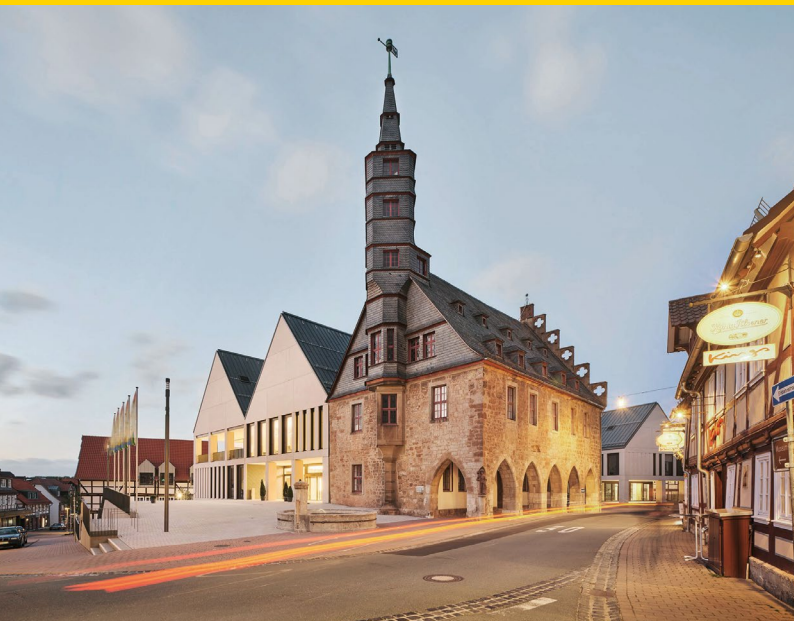
Rathaus Korbach/ARGE agn heimspielarchitekten, Münster mit Urban Mining Konzept von C5 GmbH, Münster